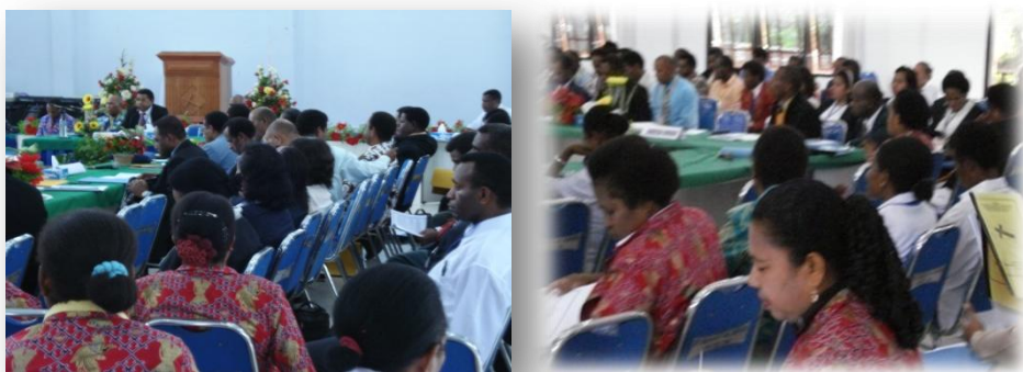
Persidangan Ilahi GPI “Jalan Suci” Cabang Jayapura Februari 2008

Maksud dan tujuan Penyusunan Laporan Kegiatan ini adalah melaporkan seluruh pelaksanaan kegiatan/program kerja Pengurus Cabang Gereja Pekabaran Injil “Jalan Suci” Jayapura yang telah diputuskan dan ditetapkan dalam Persidangan Ilahi Pejabat Gereja untuk dilaksanakan oleh Pengurus Cabang selama tahun 2006-2009 dan sekaligus sebagai bahan evaluasi untuk menetapkan dan merumuskan kegiatan/program kerja tahun 2009-2013.